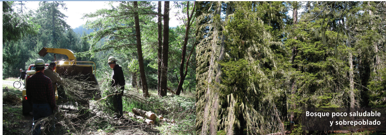
Bosque poco saludable y sobrepoblado