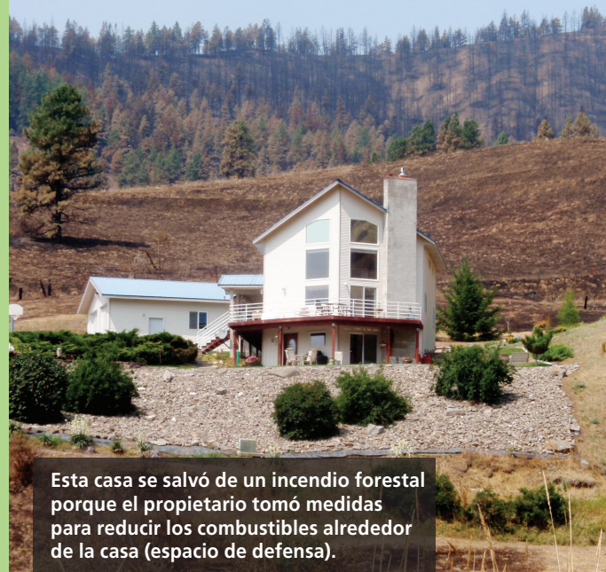
Esta casa se salvó de un incendio forestal porque el propietario tomó medidas para reducir los combustibles alrededor de la casa (espacio de defensa).