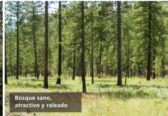
Bosque sano, atractivo y raleado